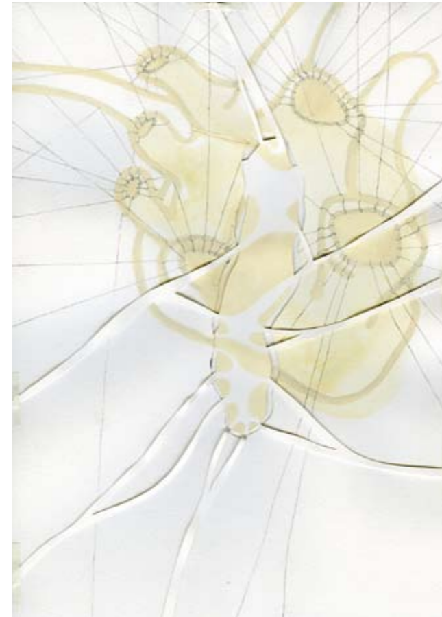
Untitled - hjartathraeding 2008

Het gelaagde landschap voert ons naar verinnerlijking. Visueel echter overheerst niet de indruk van een sterke dieptewerking. De stratificatie speelt zich overwegend af aan transparante oppervlaktelagen die de blik naar binnen uitnodigen. We kijken doorheen de herinnering en botsen op de materie van de drager. Daartussen ligt als het ware een vlies gespannen dat verschillende herinne-