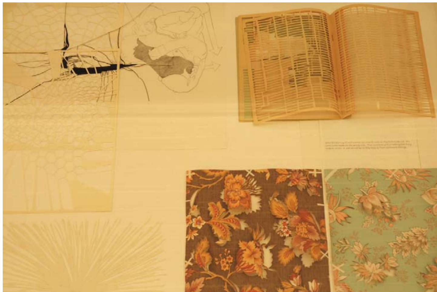
Vue list detail vitri